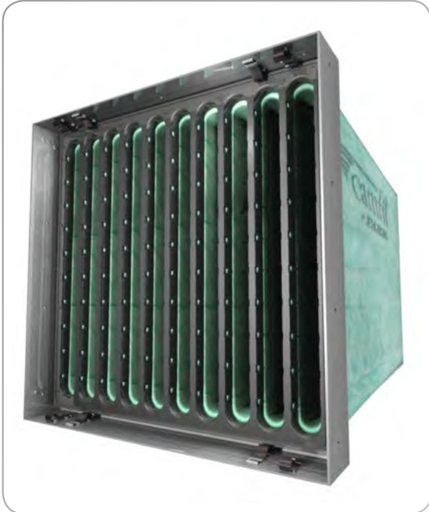
Brevet en instance